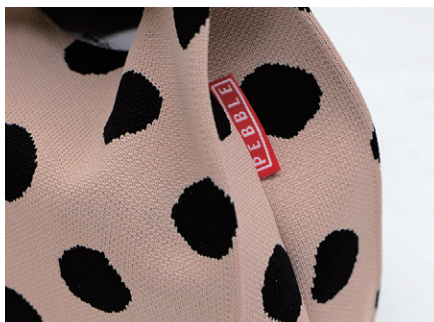
サイドにSLOWER/PEBBLEロゴ ビスネーム