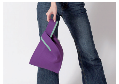
片側の取っ手を通しても持ちやすく中身も見えませぬ

製造上の都合、糸の継ぎ目や他繊維の混紡で表面の色と異なる色の繊維が見えてしまいますが不具合ではございません。