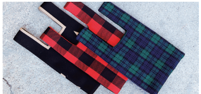
ニットなのでマチが広がりたくさん収納可能(マチ約9cm)