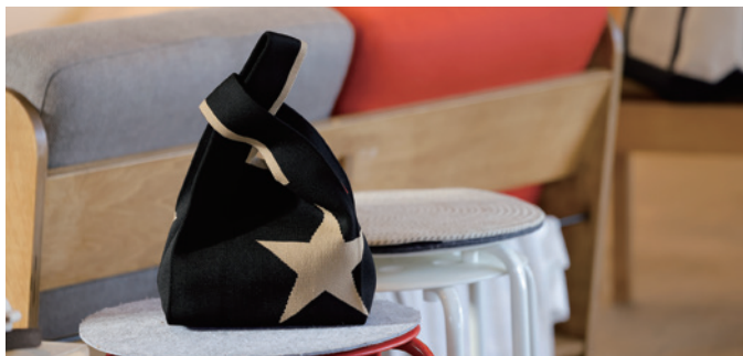
片側の取っ手を通して持ちやすく中身も見えませんが