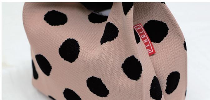
サイドにSLOWER/PEBBLEロゴ ビスネーム