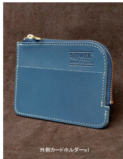
外側カードホルダー×1

手になじみやすいサイズ感が特徴です。カード、コイン、紙幣(2つ折り)収納。開閉しやすいL字ジッパーです。